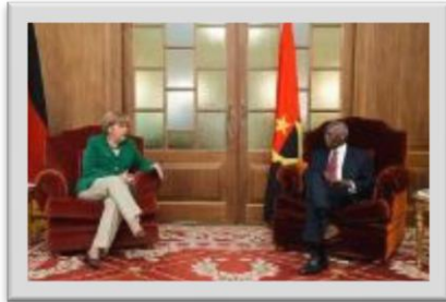
Merkel ve Jose Eduardo dos Santos

Başkanı Mwai Kibaki yaptığı açıklamada Almanya'nın çeşitli projelere 17,5 milyar shilling fon sağlayacağını açıkladı. Merkel'in tur kapsamındaki diğer durağı Angola'da ana konu ticaret ve yatırım alanlarıydı. Almanya ve Angola arasındaki ticaretin 400 milyon euro civarında seyrettiğini belirten Merkel bu oranın istikrarlı şekilde sürdürülmesi ve artırılmasına vurgu yaptı. 27 yıl süren bir iç savaş yaşayan ve yeni yeni yaralarını sarmaya çalışan Angola'ya yeniden