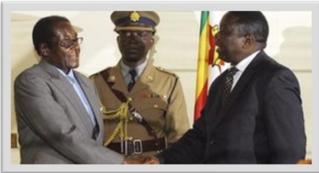
Mugabe (solda) ve Tsvangirai önümüzdeki seçimler için el sıkıştı

İnsan hakları örgütleri yeni seçimlerde taraflar arasındaki gerilimin tırmanarak şiddet olaylarının yeniden baş göstermesinden endişe duyarken, Güney Afrika Kalkınma Topluluğu (SADC) da ülkenin tekrar çatışma ve krize sürüklenmemesi için Zanu-PF ve Demokratik Değişim Hareketi arasında arabuluculuk yapıyor.