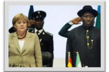
Merkel ve Goodluck Jonathan

Merkel'in tur kapsamındaki son durağı Nijerya oldu. 14 Temmuz'da Nijerya lideri Goodluck Jonathan ile bir araya geldi. Jonathan görüşmeler sırasında Almanya'nın Nijerya'nın kalkınmasındaki önemini altını çizdi. Enerjinin ana konu olduğu görüşmeler sonunda Merkel, Nijerya'da hidro elektrik tesislerinin kurulmasına yardım edeceklerini belirtti.