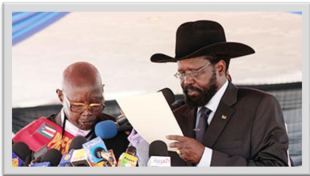
Salva Kiir yemin ederken

iki ülkenin arasında bulunan Kardofan ve Abyei bölgelerinin durumu henüz açıklığa kavuşmuş değil. Bu süreçte sadece Ocak ayından beri 260 bin kişi yerinden edildi ve yaşanan çatışmalar sonucu en az 2 bin kişi hayatını kaybetti. Bölgedeki çatışmaları durdurmak için Etiyopyalı askeri birliklerden bir tampon bölge oluşturulması konusunda anlaşma sağlanmış ve taraflar bağımsızlık kazanıldıktan sonra da görüşmelere devam etme kararı olmuş olsa da, kesin çözüm ufukta