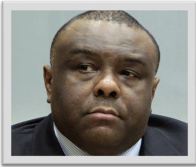
Jean Pierre Bemba

24 Temmuz'da gerçekleştirilen parti kongresinde Gombo'nun adaylığı kesinleşirken seçimlere katılıp katılamayacağı henüz açıklık kazanmadı. MLC üyeleri, Gombo'nun seçimlerde yarışabilmesi için mücadele vereceklerini ve seçim öncesi diğer partilerle ittifak kurmaya açık olduklarını ifade ettiler. UCM'de sürmekte olan davanın hukuki olmaktan çok siyasi olduğunu vurgulayan yetkililer Gombo'nun seçim öncesi serbest kalacağına inançlarının tam olduğunu kaydettiler. Geçtiğimiz yıl Ağustos ayında Gombo hakkında şartlı tahliye kararı verilmiş, ancak karar UCM Başsavcısı Luis Moreno-Ocampo tarafından temyiz edilmiş ve mahkeme Gombo'nun kaçması ve mahkemece dinlenecek tanıklara zarar vermesi ihtimallerini göz önünde bulundurarak tahliye kararını durdurmuştu.