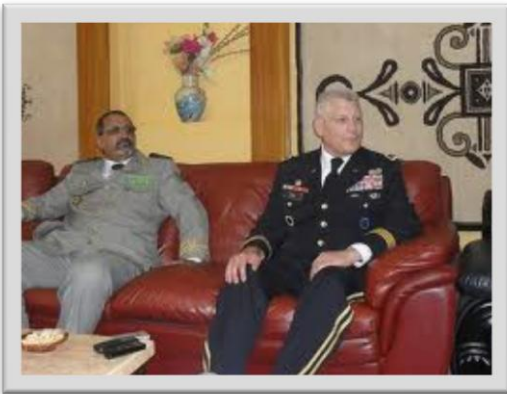
Başkan Abdülaziz ve General Ham

Moritanya, Haziran sonundan itibaren Mali sınırları içinde kalan bazı bölgeler de dâhil olmak üzere İslami Mağrip El Kaidesi'ne karşı büyük çaplı bir askeri operasyon başlattı. Operasyonda sağlanan başarı üzerine, ABD Afrika Komutası (AFRICOM) Komutanı General Carter E. Ham Moritanya'nın başkenti Nouakchott'a resmi bir ziyaret düzenleyerek Başkan Ould Abdülaziz'i bizzat tebrik etti. Yapılan basın toplantısında taraflar terörle savaş konusunda işbirliğini artırmayı planladıklarını açıkladılar.