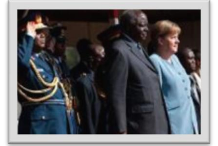
Mwai Kibaki ve Merkel

Afrika turuna 11 Temmuz'da Kenya ziyareti ile başlayan Merkel, Kenya'nın büyüyen bir ekonomiye sahip olduğunu belirtti ve iki ülke arasında işbirliğinin geliştirilmesine vurgu yaptı. Kenya Devlet