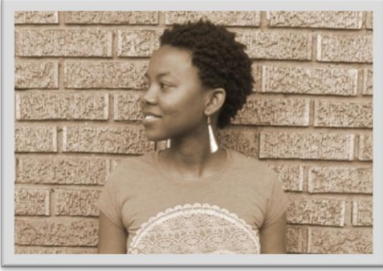
Zimbabveli yazar NoViolet Bulawayo

Afrika'nın önde gelen edebiyat ödüllerinden biri olarak bilinen Caine Ödülü ilk kez 2000 yılında Zimbabwe Uluslararası Kitap Fuarı'nda dağıtılmaya başlandı. İngilizce kısa hikâyeler yazan Afrikalı yazarlara verilen Caine Ödülü, 1999 yılında hayatını kaybeden Michael Harris Caine anısına organize ediliyor. Michael Harris Caine'in Afrika edebiyatını İngilizce'ye kazandırmak adına bir proje geliştirdiğini bilen arkadaşları, anısını yaşatmak için 2000 yılında bu organizasyona imza attılar.