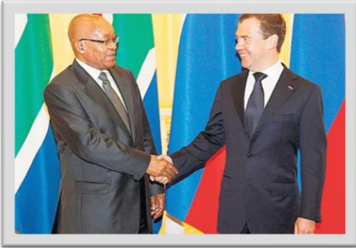
Zuma ve Medvedev

Rusya, çeşitli defalar, Libya'daki NATO bombardımanını sert dille eleştirmiş ve ittifakı, asıl odak noktası olan Albay Kaddafi'ye muhalefet eden sivilleri koruma hedefinden uzaklaşmakla suçlamıştı. Kremlin yönetimi, NATO'nun Libya liderini görevinden uzaklaştırmaya odaklandığını savunuyor. Rusya son açıklamasında da, Libya'daki durumu kontrol altına almanın yolunun derhal ateşkes ilan edilmesinden, ayrıca "müdahil olunmaksızın ülke içi görüşmelere destek vermekten" geçtiğini bildirdi. Rusya ve NATO arasında Libya operasyonu konusundaki gerginlik büyürken Rus Dışişleri Bakanı Sergey Lavrov, toplantıdan önce yaptığı açıklamada Libya anlaşmazlığının, Moskova ile NATO arasında stratejik ortaklık kurulması çabalarını engellediğini söyledi.