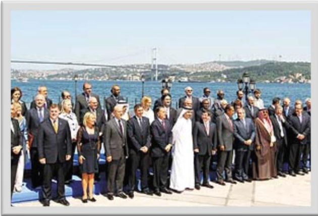
Temas Grubu'na katılan liderler hatıra fotoğrafı çekti

Ay başında Bingazi'ye bir ziyaret gerçekleştiren Dışişleri Bakanı Ahmet Davutoğlu da muhaliflerle ilişkileri düzeltme konusunda ciddi adımlar attı. Türkiye geçen ay Trablus'taki büyükelçiliğini kapatmıştı. İlişkilerin düzelmesinde Türkiye'nin Bingazi'ye 200 milyon doları kredi olmak üzere 300 milyon dolarlık yardım paketi sözü vermesi ve enerji ihtiyacının karşılanması için iki ülke arasında gaz satışına başlanması da etkili oldu. Davutoğlu'nun Bingazi gezisinin ardından, İş Bankası ve Ziraat Bankası ile birlikte % 67,5'lik hissesine Libyan Foreign Bank'ın ortak olduğu