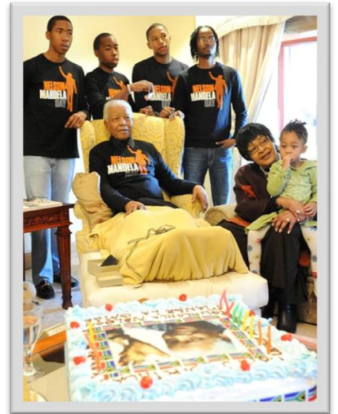
Mandela yaş gününü ailesi ve yakınlarıyla birlikte geçirdi

Güney Afrika'da aşiret ismi "Madiba"yla çağrılan Nelson Mandela, son olarak Temmuz 2010'da Güney Afrika'da düzenlenen Dünya Kupası'nın