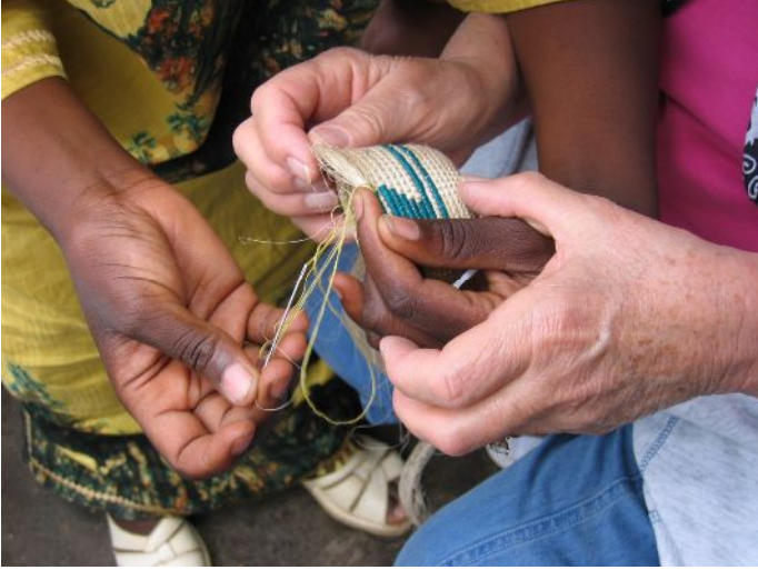
Kuzey Ruanda'da yerel tur rehberinin turistik ziyaretçilere göstermiş olduđu hasır dokuma.